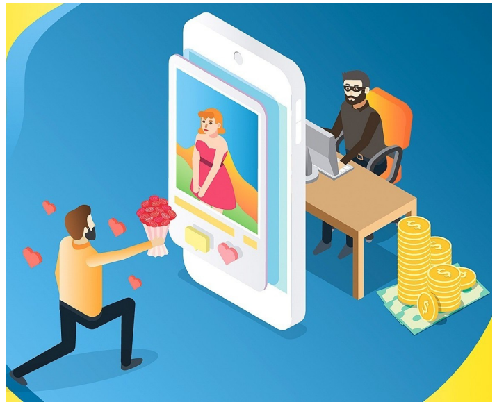
Liebesbetrug im Internet: Der frühere, klassische Heiratsschwindel hat sich zum *Romance Scam“ entwickelt.

Der Begriff „Hacking“ steht für das Eindringen in ein fremdes Computersystem durch einen oder mehrere Hacker. Ein Hack kann Angriff auf eine Infrastruktur wie beispielsweise ein Kernkraftwerk