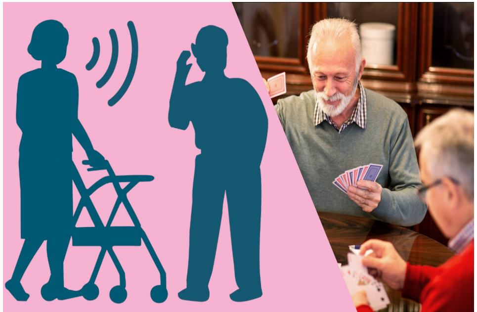
Hörhilfen: Kleine Geräte mit grosser Wirkung für die Lebensqualität.

Den Hörsinn zurückzugewinnen kann die Lebensqualität stark verbessern. Darum erleben viele Personen einen Aha-Moment, wenn sie neu eine Hörhilfe benutzen: «Warum habe ich das nicht schon vor Jahren gemacht?».