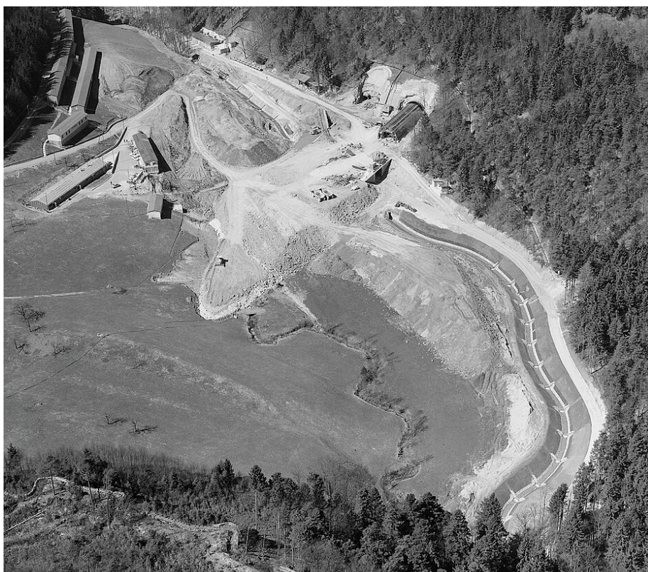
Baustelle Belchentunnel 1965, Südportal bei Richenwil (Hägendorf) mit Blick nach Nordwesten.

Punkt 10 Uhr rief Sergio, der Wirt: „Sone le ore dieci, la santa messa comincia“ – „Es ist 10 Uhr, die heilige Messe beginnt.“ Die Gläser verschwanden unter dem Tisch. Der Schrank, worin ein Altar eingebaut war, wurde geöffnet, und der Pfarrer begann die Messe zu lesen. Einmal kam der italienische Pfarrer aus Olten, ein andermal Pfarrer Zemp aus Hägendorf.