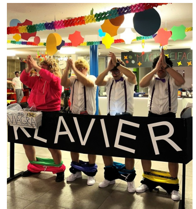
Brachten fröhliche Stimmung ins SZU: Die Hägageri-Gugge (oben links), der Root XLVII. (oben rechts), die Höckeler-Zunft (links) und die Schlumpf-Zunft.