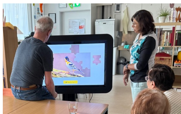
Geschicklichkeitsspiele und Aktivierungsübungen am Care Table machen Spass.

Wenn im Haus weitere Aktivitäten stattfinden, dürfen die Tagesgäste jederzeit gerne daran teilnehmen. Besonders beliebt ist die Musik am Dienstagmorgen, bei der gemeinsam gesungen und musiziert wird. Auch Auftritte, sei es musikalischer Art oder Besuche mit Tieren, bereiten den Gästen grosse Freude. Zudem besteht die Möglichkeit, am Turnen oder an Gottesdiensten im Haus teilzunehmen. Der Nachmittag bietet weiterhin Zeit für Gespräche, gemeinsames Lachen und abwechslungsreiche Unterhaltung. Um 16.30 Uhr heisst es Abschied nehmen mit einem Lächeln, schönen Erinnerungen und der Vorfreude auf den nächsten gemeinsamen Tag.