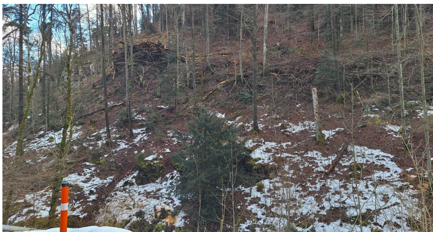
Blick von der Allerheiligenstrasse zum Holzschlag

«gerinnrelevante Prozesse», was bedeutet, dass umstürzende Bäume den Wasserablauf vom Rickenbach behindern oder aufhalten und sich daraus eine Schlammlawine bilden könnte. Der Unterhaltsabschnitt entlang dem Rickenbach-Bachlauf geht teilweise 250 bis 300 Meter den Hang bis zur Krete empor, betrifft ca. 9 Hektare Fläche und ergibt etwa 250 Kubikmeter Holzschlag.