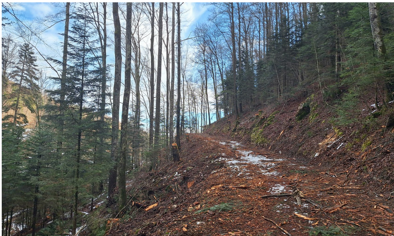
Am Ende dieses Waldweges liegt das Schnittgut (>100m 3 ) zum Abtransport bereit.

«gerinnrelevante Prozesse», was bedeutet, dass umstürzende Bäume den Wasserablauf vom Rickenbach behindern oder aufhalten und sich daraus eine Schlammlawine bilden könnte. Der Unterhaltsabschnitt entlang dem Rickenbach-Bachlauf geht teilweise 250 bis 300 Meter den Hang bis zur Krete empor, betrifft ca. 9 Hektare Fläche und ergibt etwa 250 Kubikmeter Holzschlag.