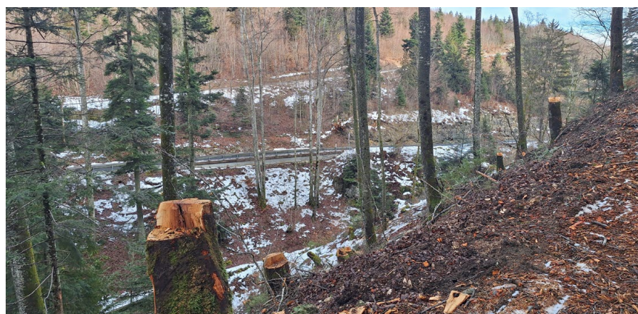
Blick vom Holzschlag über die Teufelsschlucht Richtung Allerheiligenstrasse

Der nächste Eingriff betrifft dann HÄGE11, ab dem Bereich Schlatt (östlich vom Belchentunnel), entlang dem Rickenbach auf der Ostseite. In diesem Abschnitt geht es um